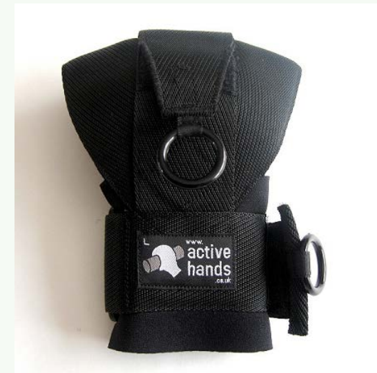
Úchopová rukavice Ob. 2