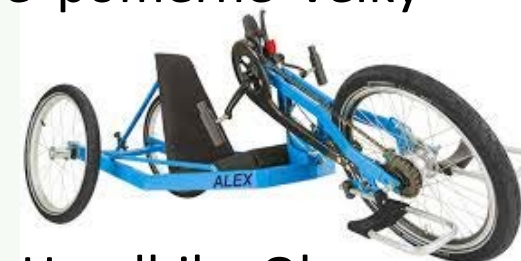
Handbike Ob. 1